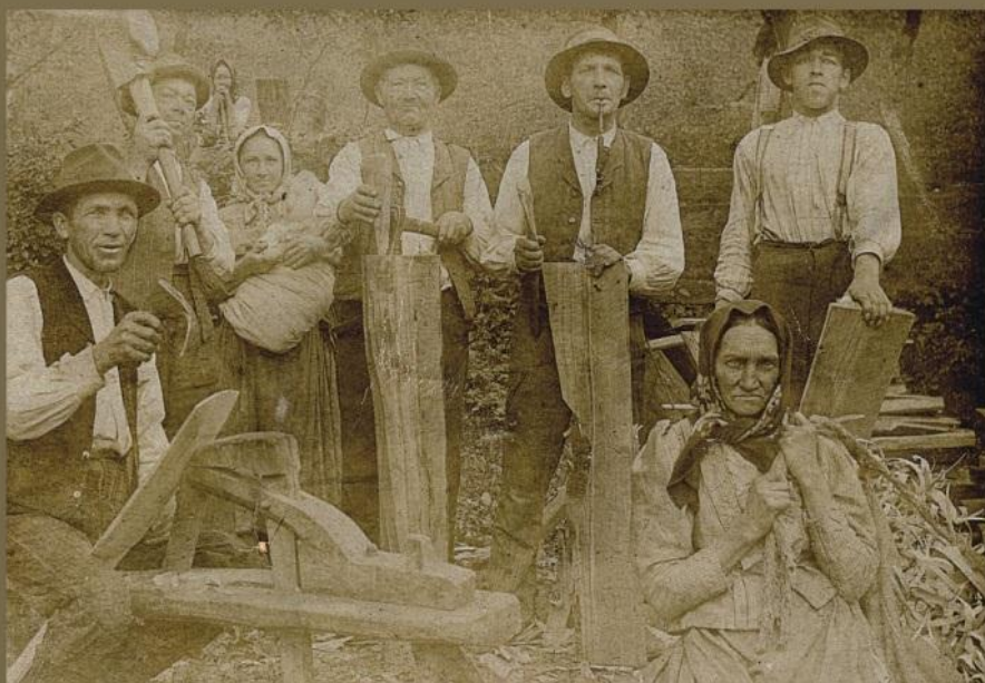
Výroba dřevěnin v Držkové

Jak už bylo zmíněno, hlavním zdrojem materiálu byly držkovské hory. Nejčastěji bylo používáno dřevo bukové (fopaty, lopatky šustáky, dénca), smrkové (šindely, v bednářství), lipové (troky, kadlby), jasanové (vidle, lepáky), ale i jiné. Důležité byly také samozřejmě nás-