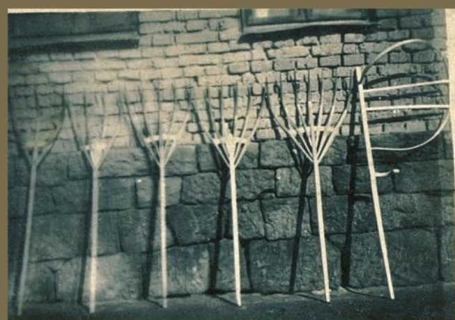
Druhy vidlí od p. Garguláka, řečeného Homolů

troje pro opracování. Před průmyslovou výrobou některých nástrojů všechno potřebné nářadí vyráběl místní kovář. Přesto zůstalo mnoho typů nástrojů, které strojově nikdy vyráběny nebyly. Podle způsobu, jak na nástroje lidská ruka působí, je můžeme rozdělit do několika skupin: nástroje, na které působí člověk úderem (různé sekery, dláta, také motyčka kopačka, krňá), tahem (nejrůznější pily a pilky, pořizy různých tvarů a velikostí, škobly, škrabky, šindelářské výstruhy, hoblíky), rotací (vrtáky, nebozezy, soustružnické nože). Kromě kovaných železných nástrojů se používaly dřevěné šablony, kružidla, přichycovala a za vůbec nejdokonalejší a dosud stále nenahraditelný nástroj/pomůcku, používanou téměř při každém výrobním postupu, je považována dřevěná stolice zvaná také strýc. Tato „stolica“ sloužila k přidržování a upevňování obráběného výrobku.