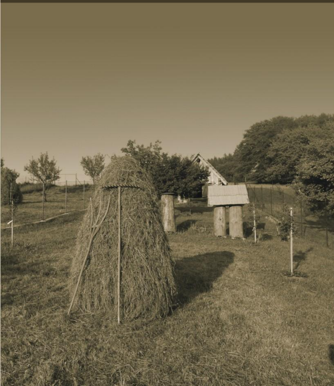
Sušení sena na ostrévkách